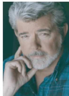
ジョージ・ルーカス