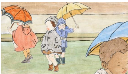
『濡れた髪 / The Wet Hair』