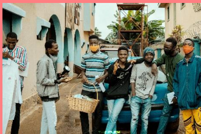
クリティクスカンパニー