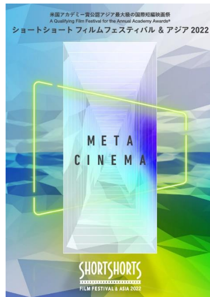
<映画祭ポスタービジュアル>