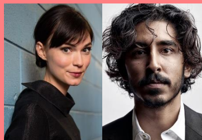
ティルダ・コブハム=ハーヴェイ & デーヴ・パテル