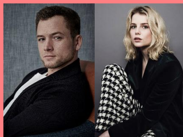
タロン・エガートン & ルーシー・ポイントン