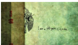
『663114』 ヴェネチア国際映画祭 2011 (イタリア) 平林勇 | 日本 | 8:00 | アニメーション | 2011