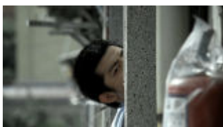
『XXな男2人と美少女』 Bruce Hwang Chen | 台湾/アメリカ | 15:00 | コメディ | 2010